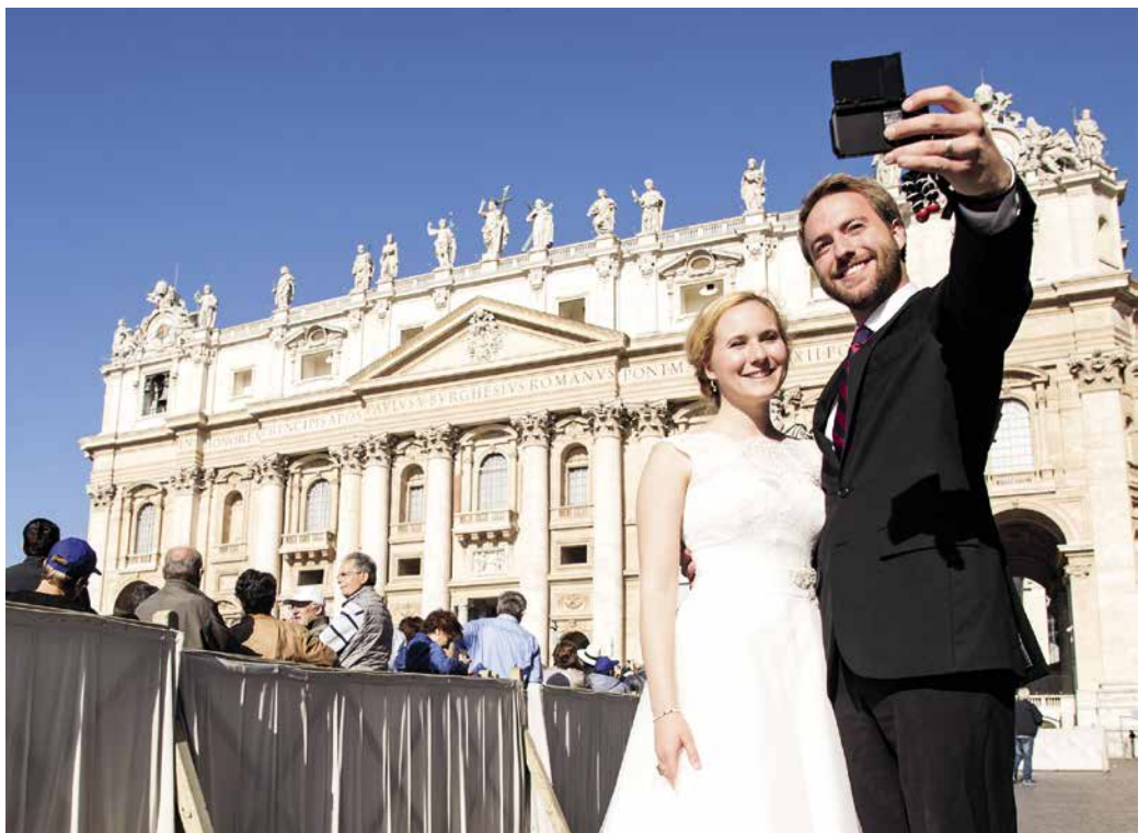
Pour le Pape, les fiancés « ont la bonne volonté mais pas la conscience de ce qu'ils demandent ».

Comment réagir? « La grande majorité des mariages sont nuls », avait déclaré le pape François lui-même (2016), précisant