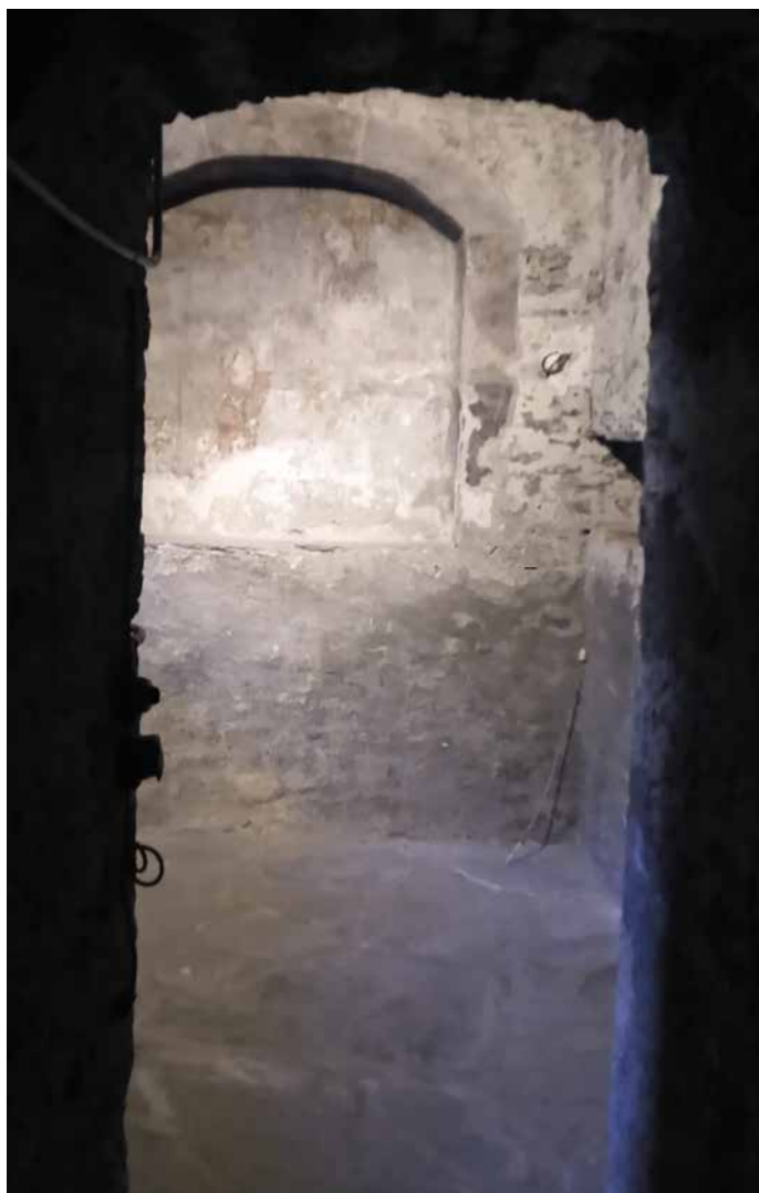
La messe de saint Grégoire (XV e siècle), dans le clocher d'Orsières.

Le culte eucharistique lié à ce miracle se développe de l'Italie vers l'Allemagne, entre autres par l'affluence de pèlerins lors des grands jubilé depuis le premier jubilé célébré en 1300. Avec la peste, les chrétiens cherchent à rester unis à Jésus qui souffre avec nous. La représentation de la messe de saint Grégoire, se diffuse alors largement. Elle nous fait prendre conscience que nous ne sommes pas orphelins. Jésus vient en nous. Il nous soutient et nous aide à avancer vers le ciel.