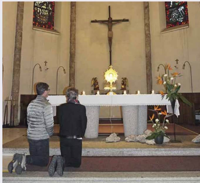
L'adoration, un moment privilégié de rencontre avec le Seigneur.

Dans les paroisses de l'Entremont, il y a la possibilité d'Adorer Jésus chaque jour de la semaine. Pourquoi ne pas commencer par se joindre quelques instants aux adorateurs présents. Et puis, faire le saut! Devenir à son tour « gardien du Saint Sacrement » en assurant une présence une heure par semaine.