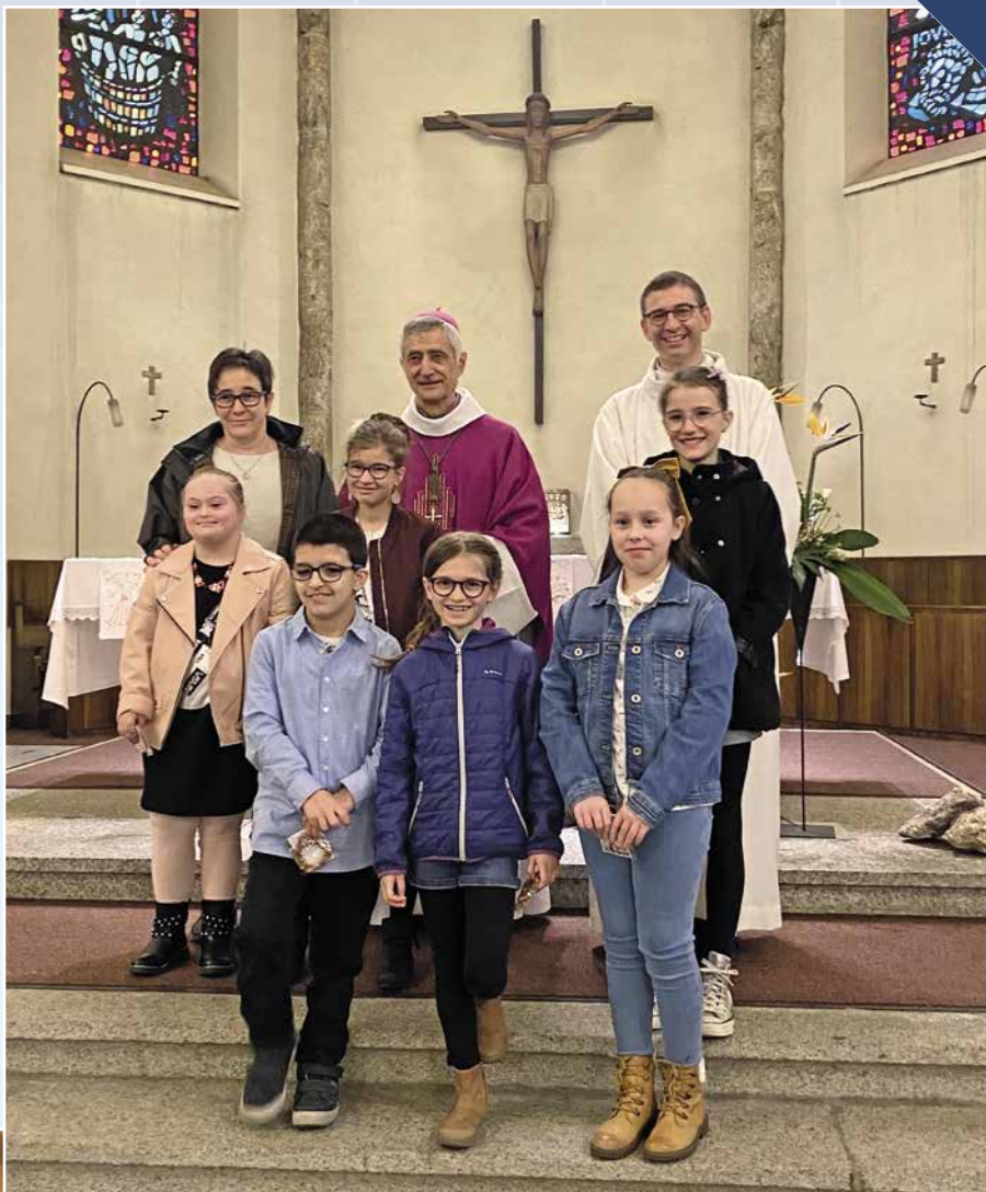
Confirmands d'Orsières.