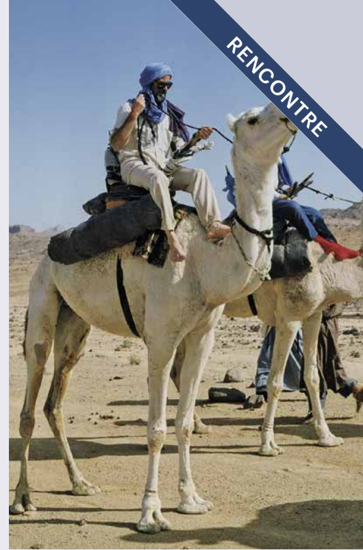
Randonnée chamelière dans le Hoggar.