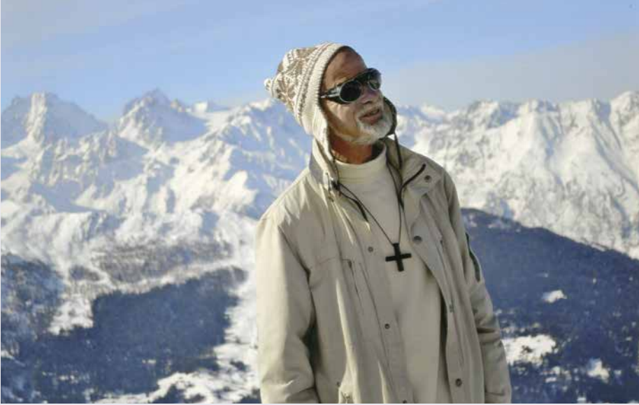
Sur les hauteurs du Val de Bagnes.