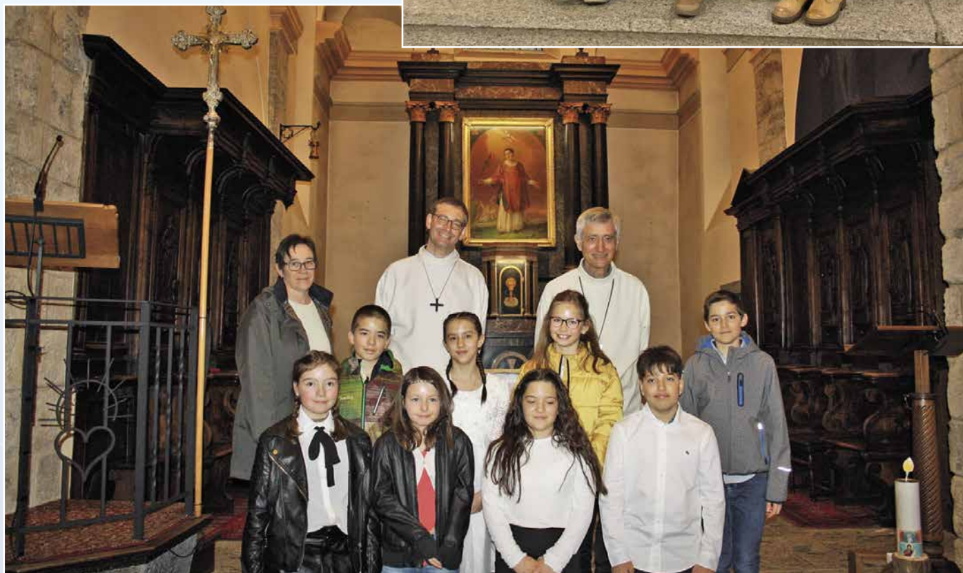
Confirmands de Sembrancher.