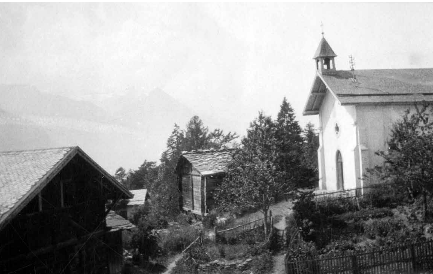
Chemin-Dessus il y a presque cent ans...