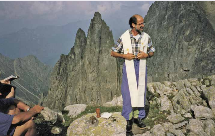
Messe au cours d'une semaine Montagne et prière.

éclairer : « Il y a en moi un puits très profond. Et dans ce puits, il y a Dieu. Parfois, je parviens à l'atteindre. Mais plus souvent, des pierres et des gravats obstruent ce puits et Dieu est enseveli. Alors il faut le remettre au jour. » Ces mots sont une invitation pour chacun à quitter la superficialité pour faire silence afin de trouver ou retrouver l'« être » qui est relation avec Dieu.