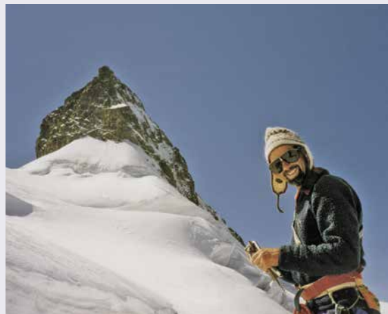
Guide sur le chemin de la Haute-Route.

L'exploit pour être connu ou reconnu ne m'a jamais tenté. Mais la montagne a fait éclore en moi le désir... du désert, cet endroit dépouillé de tout, espace de solitude et de conditions extrêmes qui anni-