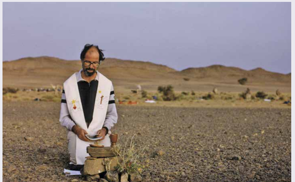
Messe lors de la randonnée dans le Hoggar.

à 1943, année de sa mort dans le camp d'Auschwitz. Sa relation intime avec Dieu, dans les conditions atroces qui étaient les siennes lors de la guerre, est pour moi une source inépuisable d'émerveillement. Voici un court passage qui pourrait nous