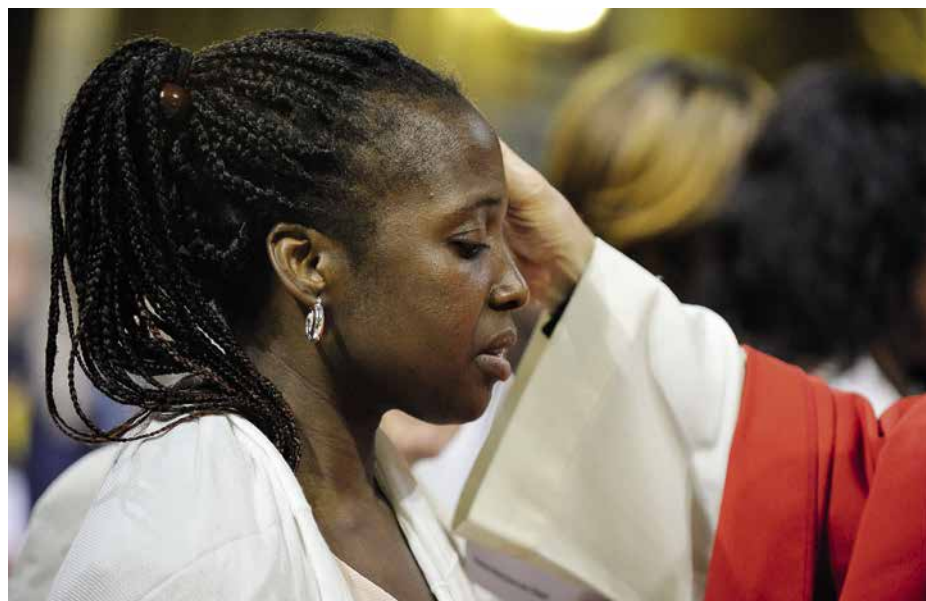
La demande d'un sacrement a toujours une issue concrète: mariage prochain, curiosité, recherche de sens...

La demande d'un sacrement a toujours une issue concrète: mariage prochain, devenir marraine/parrain, curiosité, recherche de sens...; elle est une première réponse