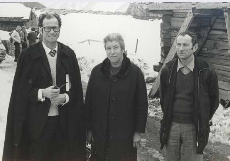
Jeune prêtre, avec ses parents.